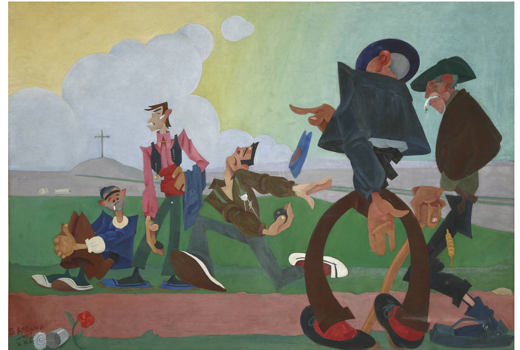
S/T "Boleo en las eras de la Cruz" (1930). Oleo sobre lienzo 146 x 210 cm.