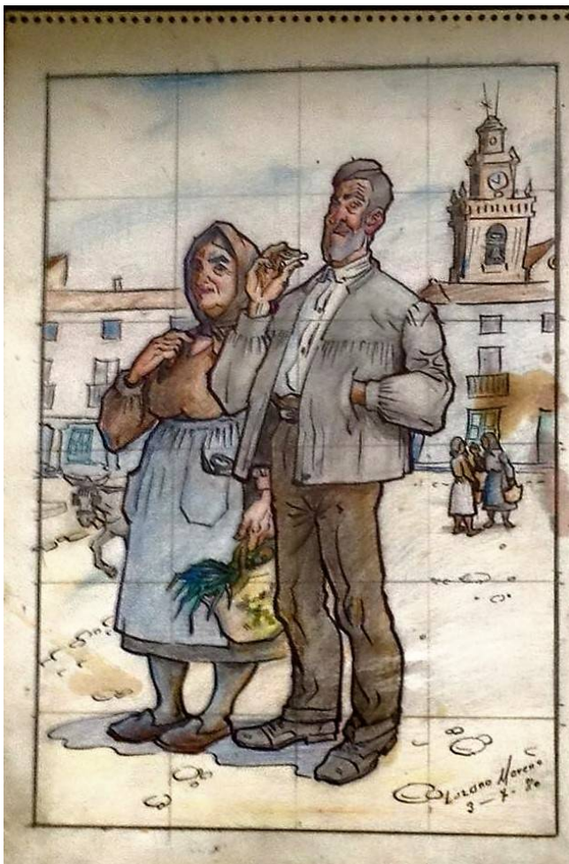
Boceto a lápiz "En la Plaza", 1980, 35 x 25 cm.

Por último, la séptima sala seguirá acogiendo las obras galardonadas en el Vivero de Artistas, espacio fundamental que, junto con el de exposiciones temporales, consigue que esta primera planta de Casa Parada sea siempre un espacio activo.