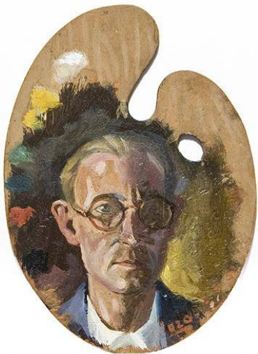
Autorretrato (1945). Óleo sobre tabla. 14 x 9,5 cm.

De este modo, los trabajos académicos —realizados en los años que Lozano estudiaba en la Escuela de San Carlos de Valencia— ocupan la segunda sala y nos sitúan en el germen de la actividad pictórica del artista.